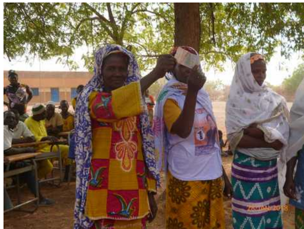
Cérémonie de passation entre les femmes soutenues en 2017 et celles choisies pour 2018